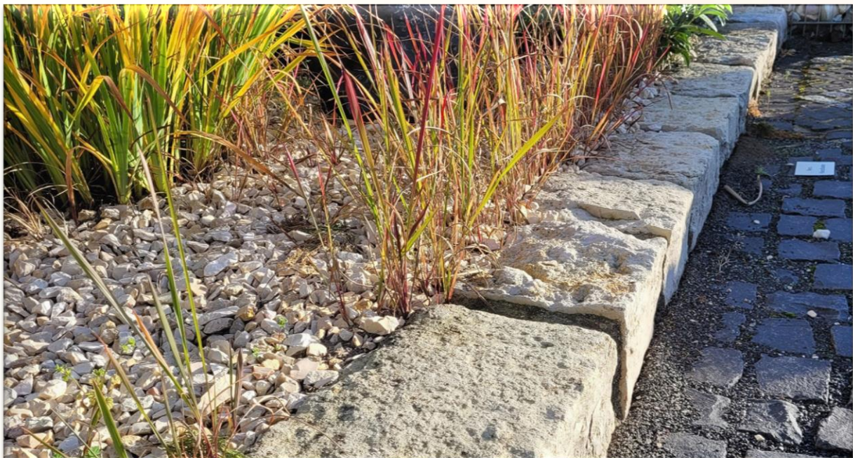
TOSKANA Zierschotter und TOSKANA Mauersteine als Beeteinfassung

# 638 TOSKANA Bruchsteine – Jurakalk beige. Diese Bruchsteine gibt es von ca. 30 cm Durchmesser bis hin zu über einem Meter. Sie sind der Blickpunkt einer modernen Gartengestaltung und heben sich vor allem von dunklem Pflaster oder Schotterflächen gut ab.